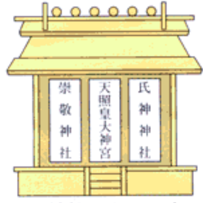
お神札のおまつり方